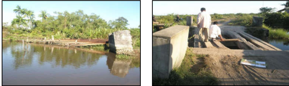
Gambar 5 : Kondisi Kerusakan jembatan yang disebabkan bencana alam.